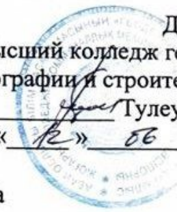
График итоговой государственной аттестации 2023-2024 учебного года для группы 41 ДС